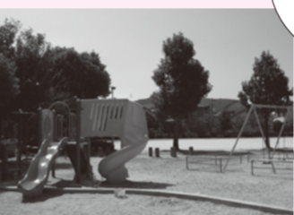
田隈中公園(田隈校区) *広々としたきれいな公園です。大きな東屋があるので、ひと休みもできます。