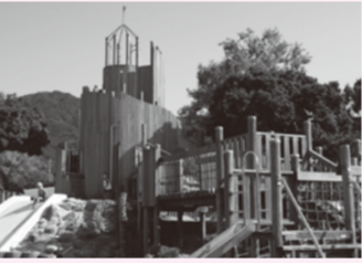
西油山中央公園(野芥校区) *「子どものお城(通称)」と呼ばれるアスレチックがあります。広々とした公園で、桜やどんぐりの木もあって、森林浴もできます。